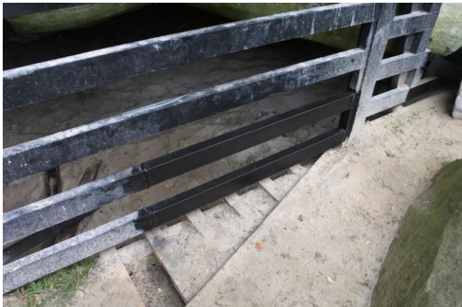
La partie peinte en noir qui avait été recoupée est désormais ressoudée