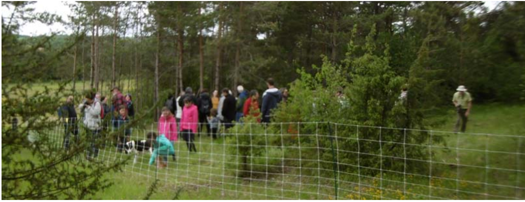
C'est accompagné de nombreux habitants du village de Champmotteux que le troupeau de moutons a transhumé vers la pelouse sèche de la haye Thibaut le 13 mai 2018