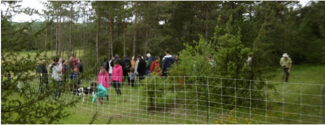
C'est accompagné de nombreux habitants du village de Champmotteux que le troupeau de moutons a transhumé vers la pelouse sèche de la haye Thibaut le 13 mai 2018