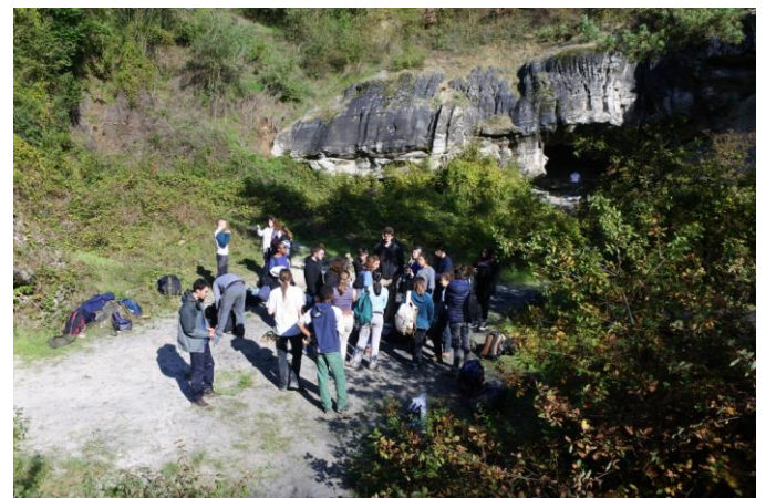
Les étudiants à pied d'oeuvre

Nous avons donc organisé un chantier avec des étudiants d'un BTS Gestion et Protection de la Nature et aidés par deux entreprises remplacé les deux panneaux volés et les cadenas, repeint les grilles taguées, collé les silex, posé du barbelé et des branchages épineux dans les descentes et sur le pourtour haut du site, bétonné une petite ouverture après avoir refixé la tôle qui avait été découpée, ramassé un sacré volume de déchets que nous avons ensuite déposé soit dans nos poubelles pour la partie recyclable, soit à la déchetterie pour le reste.