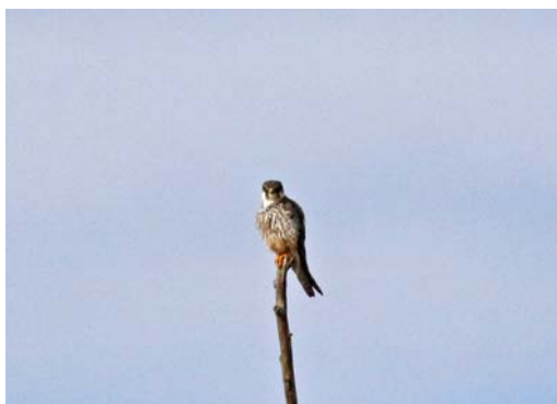
Fontenay le Vicomte Levant