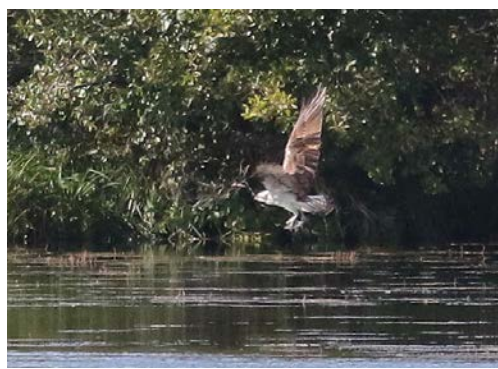
Fontenay le Vicomte – Les Moines

Observatoire des Moines: Quelques observations intermittentes ont été réalisées sur ce site fréquenté quelques fois par le Balbuzard pêcheur mais pas par le Blongios.