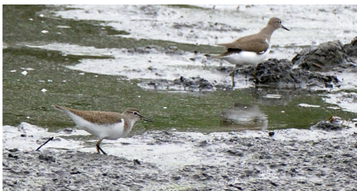
Itteville observatoire des Fauvettes

Grandes Aigrettes, Râles d'eau, Martin pêcheurs, Grèbes castagneux fréquentent régulièrement ce site.