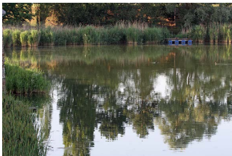
Rive Nord étang neuf Saclay

17 prospections pour un total de 38,55 heures réalisées sur ce site.