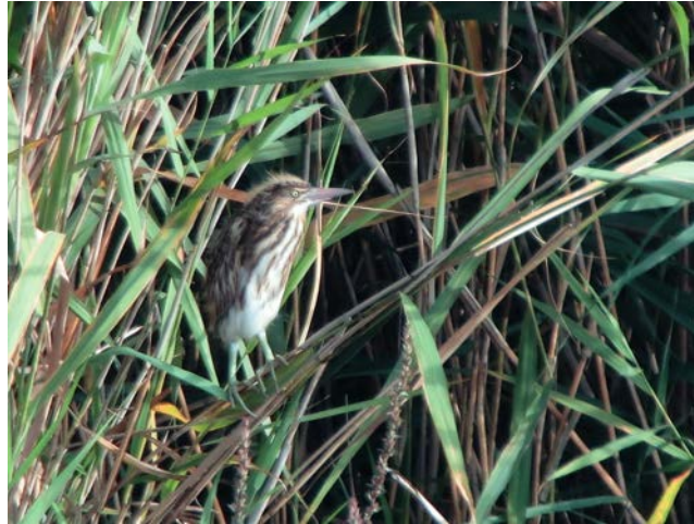
Blongios juvénile

Depuis 1997, l'association NaturEssonne assure un suivi de la population de Blongios nain en Essonne afin de mieux connaître sa répartition, son comportement, sa nidification et ainsi participer à sa préservation. Un suivi régulier des effectifs du Blongios nain, avec le soutien du Conseil départemental de l'Essonne, est assuré d'avril à septembre par des adhérents de l'association.