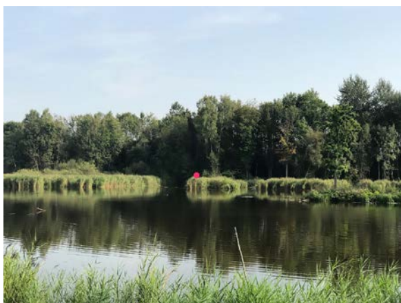
Zone de nidification- Observatoire des Gravelles

62 prospections pour 256h45 à l'observatoire des Gravelles et 40 prospections pour 123h10 à celui de la Tour seront réalisées par les bénévoles.