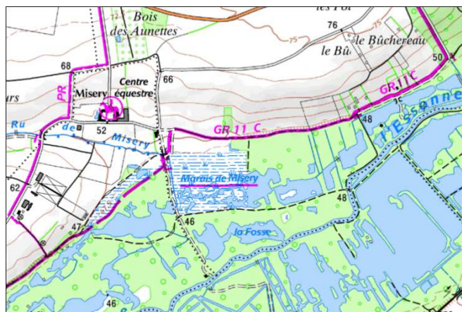
Misery (commune d'Écharcon)