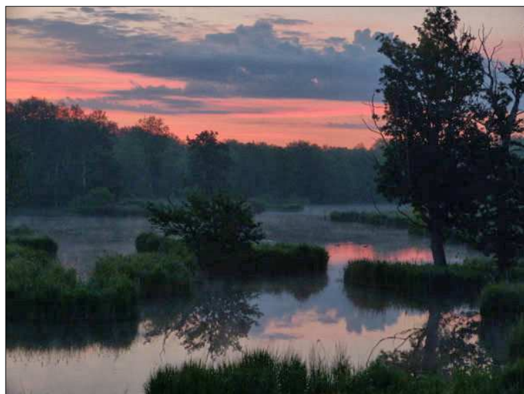
Misery à l'aube © Odile CLOUT