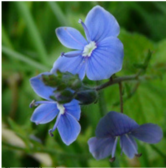
Fleur de Véronique