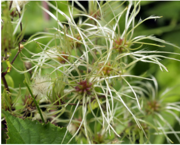
Fruits de la Clématite des haies