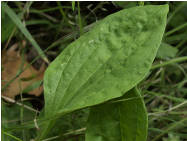
Plantain, l'herbe aux 5 coutures