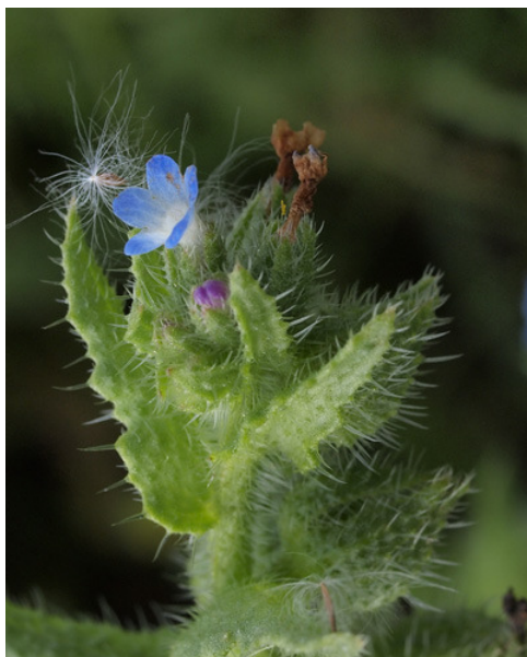
Buglosse des champs