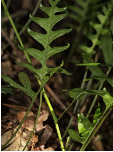
Polypode commun ou "régliasse des bois"