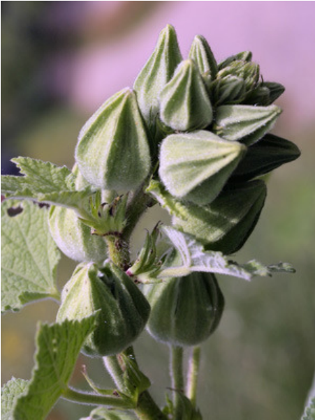
Boutons floraux et fleur de la Rose trémière