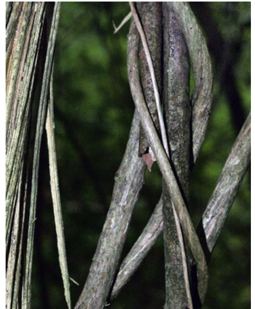
Liane de la Clématite des haies