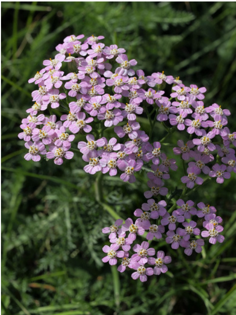
Achillée millefeuille en fleur