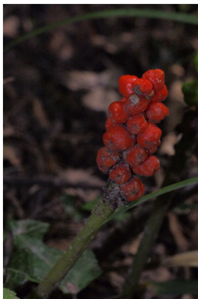
Fruits de l'Arum d'Italie