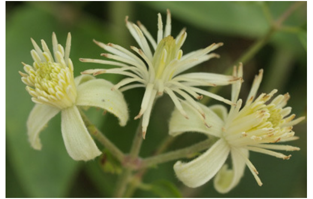
Fleur de Clématite des haies