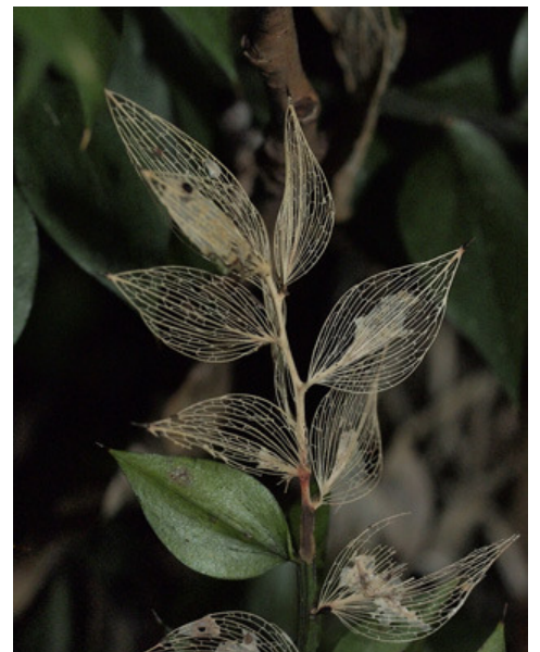
Fragon petit houx