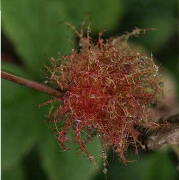
Un bel exemple de bédégar (revoir à ce sujet la Chronique Vagabonde n°4)