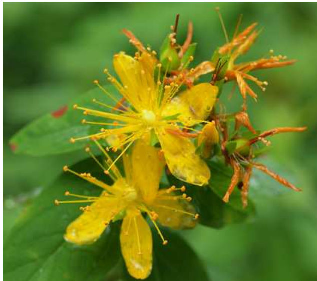
Fleurs de Millepertuis