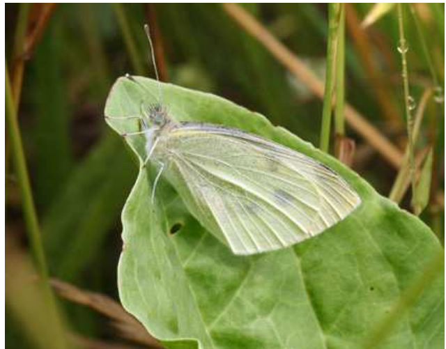
Piérade de la rave

Patrick nous a très agréablement guidés tout au long de cette sortie, un peu mouillée, certes, mais que personne n'a regretté d'avoir maintenue ! Ces images en sont la preuve. Alors, pourquoi ne pas revenir à l'automne, puis en hiver ? Odile Clout - juillet 2012