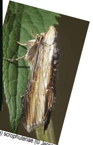
C. (Shargacucullia) scorpulariae