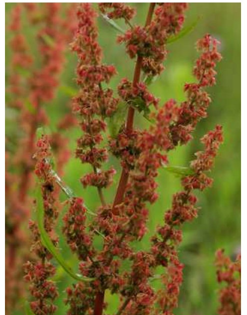
Oseille des prés