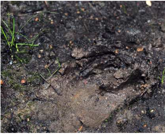
Trace de Chevreuil