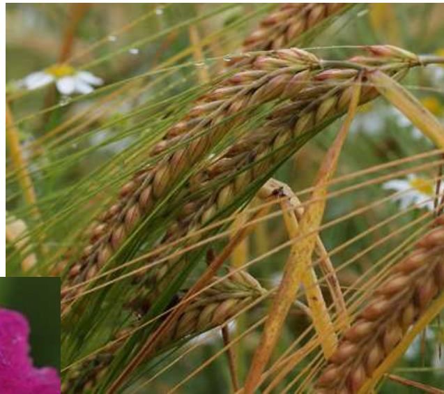
Orge sous la pluie