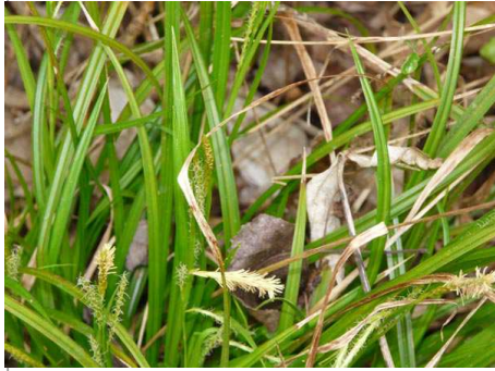
Voici le Carex des Bois