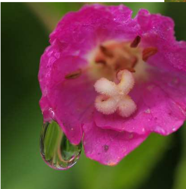
Goutte sur fleur d'Épilobe hirsute