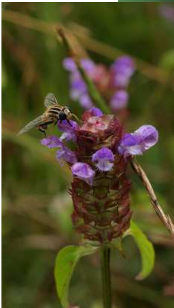
Hélophile à bandes grises sur Brunelle