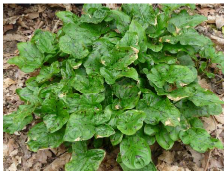
Un autre d'Arum tacheté.

"L'arum sauvage est l'arum tacheté ou pied de veau ou gouet baptisé par les botanistes Arum maculatum en raison de ses feuilles en fer de flèche et tachetées de noir. Il est très commun en France et apprécie particulièrement les sols riche en nitrate ou en calcaire qu'ils soient frais ou secs." [source http://forum.notretemps.com/post4523.html ]