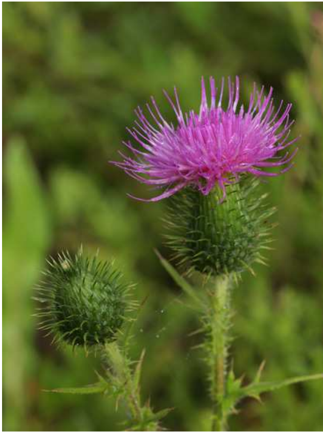
Cirse des prairies

Trouvé sur le net : Marasme petite roue Marasmus rotula